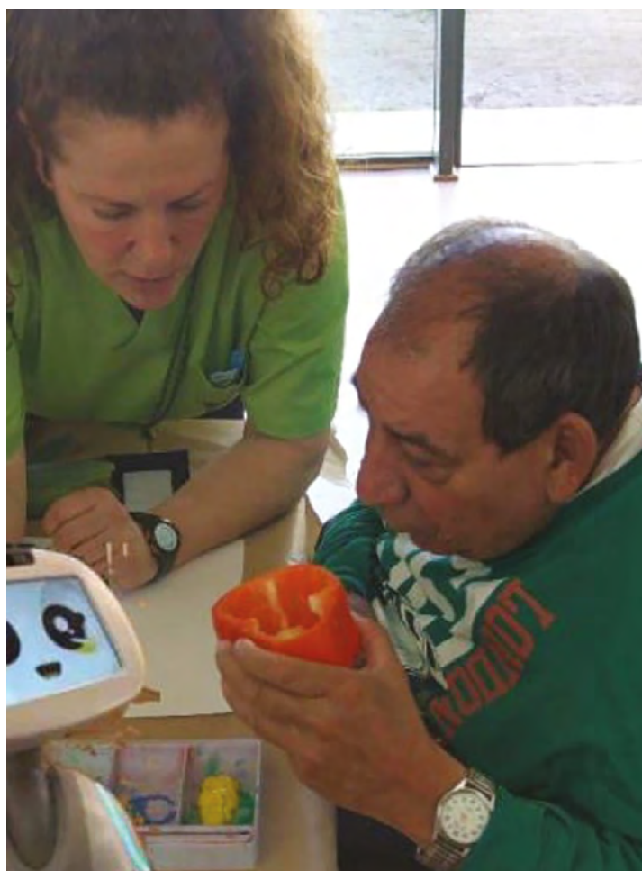
Figura 1. Un profesional enseña a una persona con ID. La imagen está extraída de la página web de IRD.

El siguiente artículo pone de manifiesto que la IA puede aplicarse como coadyuvante de los profesionales para mejorar la calidad de vida (CdV) de las personas con discapacidad intelectual proporcionando información sobre los apoyos necesarios que pueden lograrse con la ayuda de modelos de aprendizaje automático (AA), también conocido como Machine Learning (ML). Los modelos de AA analizan los distintos aspectos de la CdV de las personas con discapacidad, indicando tras el análisis si el individuo necesita apoyo o no. Si la persona necesita apoyo, el modelo analiza qué aspecto de la CdV necesita cada categoría de apoyo. Hay tres categorías de apoyo: apoyo inmediato, apoyo secundario y apoyo opcional. La CdV de una persona con DI está definida por ocho aspectos que cubren las áreas personal, social y legal de su vida. El modelo proporciona un informe de apoyo que contiene posibles acciones para mejorar cada aspecto de la CdV del sujeto en función de sus necesidades.