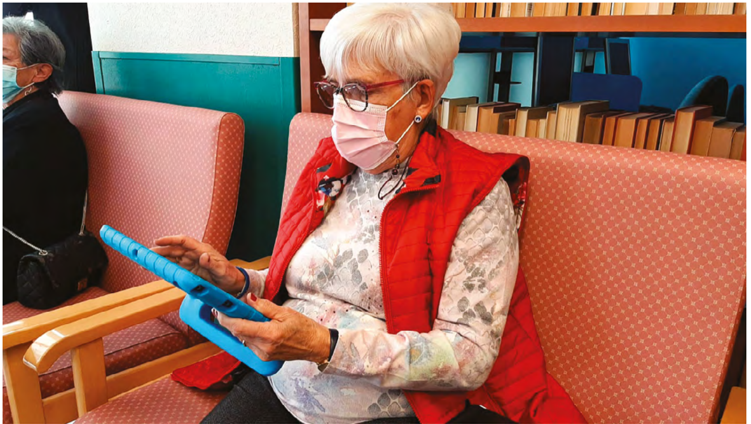
Figura 2. Adulto mayor con ID

funcionamiento adaptativo (tareas cotidianas como la comunicación y la vida independiente). Los déficits de inteligencia y capacidad de adaptación comienzan en la infancia. Se considera que los menores de 18 años tienen DI si su coeficiente intelectual (CI) es inferior a 70 y también muestran un funcionamiento adaptativo afectado 1 . La DI puede manifestarse en formas menos graves a más graves. Alrededor del 85% de los casos se consideran moderados (CI entre 50 y 70). Estos niños pueden seguir estudiando, aprender a ser independientes, formarse e incluso ejercer una profesión. Un CI de entre 35 y 50 se considera DI moderada. Los niños suelen necesitar cuidados y atención, aunque también pueden funcionar de forma independiente. Los casos con un CI de entre 20 y 35 corresponden a una DI grave. Estos individuos son menos hábiles y tienen poca comprensión de los números y la lectura, y hay que supervisarlos constantemente 2 .